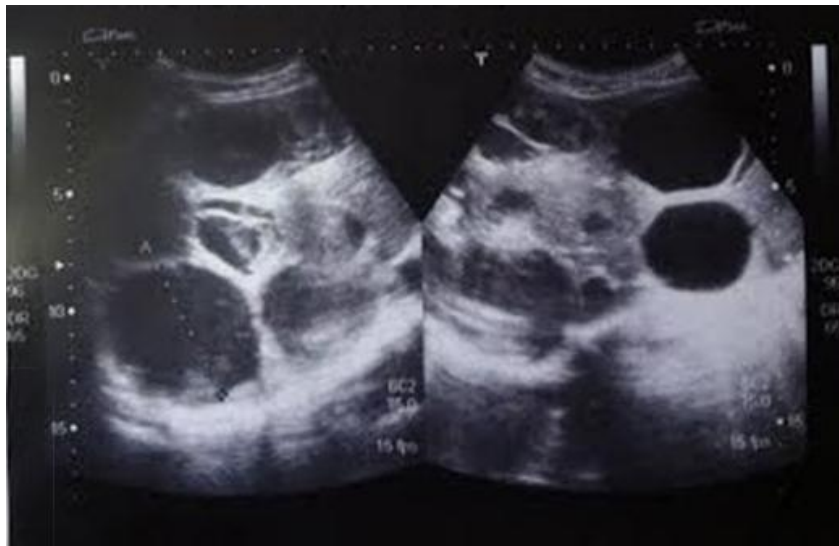
Figura 1. Ecografía abdominal que evidencia numerosos quistes hepáticos.

Se solicita ecografía abdominal (véase Figura 1) que informa innumerables quistes hepáticos, de aspecto hidatídico en ambos lóbulos, algunos simples y otros con membranas de hasta seis centímetros. La radiografía de tórax (Figura 2) anteroposterior y lateral, evidencia al menos cuatro quistes pulmonares y uno roto que desemboca en bronquio derecho.