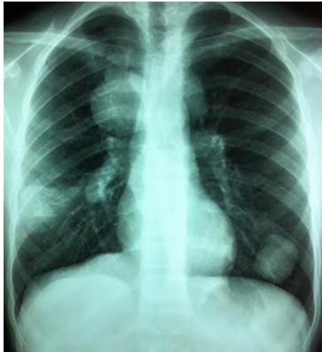
Figura 2. Radiografía de tórax con al menos cuatro imágenes quísticas y un quiste roto en bronquio derecho.

Se inició tratamiento con albendazol 15 mg/Kg/día y se deriva a la unidad de cirugía infantil del Hospital Regional de Talca para resolución quirúrgica. Los exámenes preoperatorios mostraron eosinofilia 13%, velocidad de eritrosedimentación (VHS) 67, perfil hematológico normal, pruebas de coagulación y función renal normal.