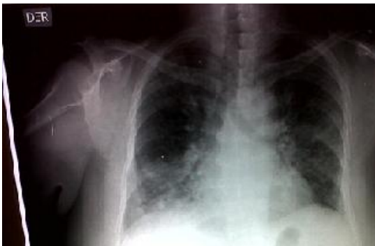
Figura 1. Silueta cardíaca con ventrículo izquierdo de tamaño normal. Se observa ocupación del espacio alveolar parahiliar bilateral y radioopacidad parenquimatosa poco definida, con tendencia a la confluencia en el segmento basal del lóbulo inferior derecho con broncograma en su interior. Esto puede deberse a zona de consolidación neumónica.