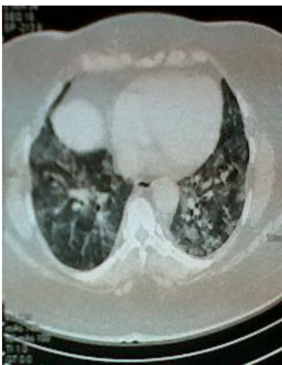
Figura 2. Se observan opacidades difusas no homogéneas, en algunos segmentos con tendencia a la consolidación, evidenciándose broncograma aéreo, con engrosamiento septal e imágenes en vidrio esmerilado.